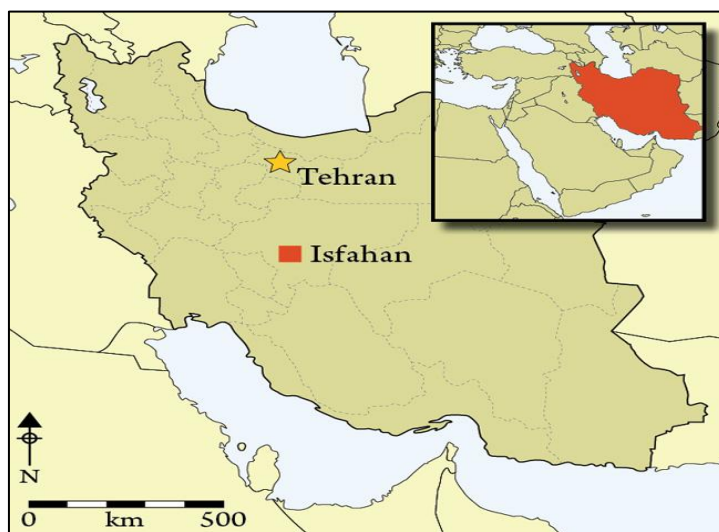
نقشه شماره ۴- موقعیت شهر اصفهان

اصفهان همچنین با تولید فرش‌های زیبا، غذای لذیذ بریانی، موسیقی سنتی و باشگاه‌های ورزشی اش نیز شهره خاص و عام است (غلامی و دیگران، ۱۳۹۴: ۸۵).