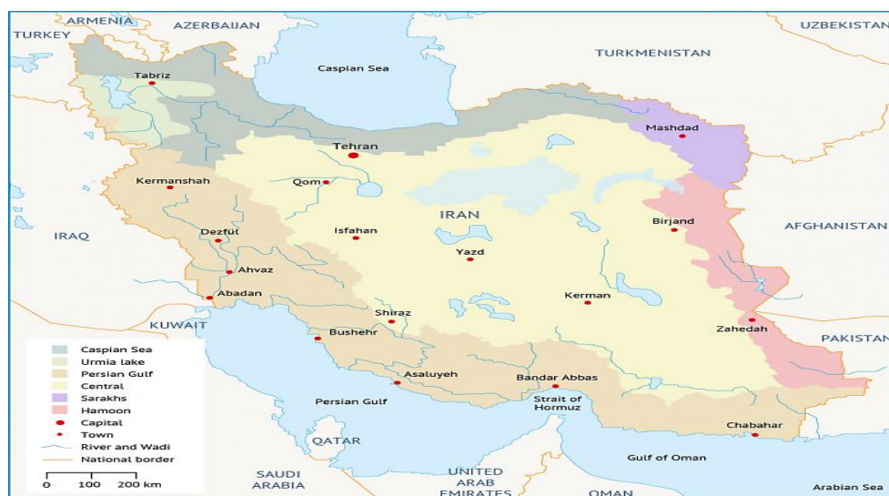
نقشه شماره ۱- کلان‌شهرهای ایران

در تعریف بین‌المللی کلان‌شهر که سازمان ملل متحد آورده است، کلان‌شهر یا مادرشهر به شهرهایی گفته می‌شود که بیش از ۸ میلیون نفر جمعیت داشته باشند. از این رو با توجه به دیدگاه تعریف بین‌المللی، در ایران فقط شهر «تهران» به‌عنوان کلان‌شهر شناخته می‌شود. درعین حال، همان‌طور که تعریف مفهوم شهر در کشورهای مختلف متفاوت است، تقسیم‌بندی انواع شهرها نیز برحسب میزان فعالیت‌ها، میزان جمعیت‌پذیری و حوزه نفوذ شهر در کشورهای گوناگون با یکدیگر یکسان نیست؛ اما در ادبیات رایج کشور ایران، اصطلاح کلان‌شهر معادل مادرشهر است و به شهرهایی اطلاق می‌شود که حداقل یک میلیون نفر جمعیت داشته باشند، واجد مرکزیتی اقتصادی و سیاسی باشند و در مقیاس ناحیه‌ای یا ملی از موقعیتی مرکزی برخوردار باشند (فرجی‌راد و دیگران، ۱۳۹۵: ۱۳۰).