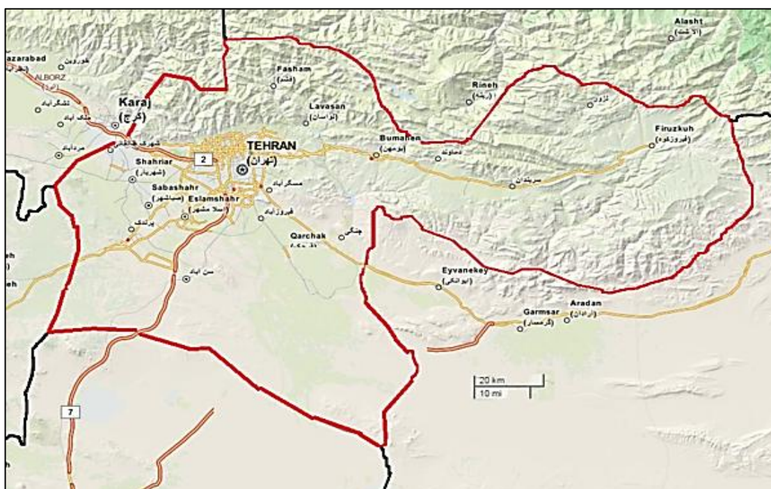
نقشه شماره ۲- کلانشهر تهران

تهران پایتخت ایران و نیز مرکز استان تهران است. تهران همچنین با ۱۵۲۳۲۵۶۴ نفر جمعیت، بزرگ‌ترین و پرجمعیت‌ترین شهر ایران نیز محسوب می‌شود. تهران به لحاظ جمعیتی دومین شهر بزرگ غرب آسیا، سومین شهر بزرگ خاورمیانه و بیست و نهمین شهر بزرگ جهان است. در سال ۱۱۶۱ هجری شمسی، آقا محمدخان قاجار پس از به قدرت رسیدن، تهران را به عنوان پایتخت خود انتخاب کرد. در حال حاضر، اقوام متعدد و گوناگونی در این شهر زندگی می‌کنند. فارسی با لهجه‌ی تهرانی، زبان متداول و رایج این شهر است. اکثریت جمعیت تهران را شیعیان اثنی عشری و اقلیت‌های سنی و مسیحی تشکیل می‌دهند. تهران قطب اقتصادی ایران محسوب می‌شود، چرا که ۳۰ درصد از نیروی کار و نیز ۴۵ درصد از شرکت‌ها و صنایع کشور در این شهر متمرکز شده‌اند. تهران همچنین به دلیل در اختیار داشتن جاذبه‌های فرهنگی بسیار، از جمله مقاصد گردشگری بزرگ کشور نیز محسوب می‌شود (موسوی و فتاحی فرزانه، ۱۳۹۵: ۸۰).