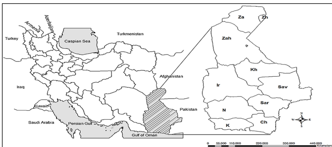
نقشه شماره ۳- موقعیت استان سیستان و بلوچستان

استان سیستان و بلوچستان با وسعتی معادل ۱۸۷ هزار کیلومتر مربع به عنوان پهناورترین استان کشور از نظر پیشرفت و توسعه در شرایط خوبی نیست. علیرغم تلاش دولت‌های مختلف در طی سی و پنج سال گذشته، سیستان و بلوچستان به عنوان یکی از محروم‌ترین استان‌های کشور مطرح است. رتبه‌ی اول بیکاری، رتبه‌ی اول بی‌سوادی، رتبه‌ی اول زایمان‌های غیربهداشتی (زایمان در منزل)، رتبه‌ی اول بیماری‌های ایدز و سل، وجود بیش از پانصد هزار نفر تحت پوشش نهادهای حمایتی از جمله کمیته‌ی امداد و بهزیستی تنها گوشه‌ای از عقب‌ماندگی‌های استان است. در این شرایط به نظر می‌رسد که اگر قرار است که در مورد تقسیم استان تصمیم‌گیری شود شایسته است مبنای این تصمیم‌گیری توسعه‌ی استان باشد. باید به این نکته توجه داشت که عقب‌ماندگی استان محصول عواملی است از جمله: محرومیت تاریخی به جای مانده از بی‌توجهی حکومت پهلوی، دوری راه به نحوی که هزینه‌ی پروژه‌های عمرانی را بسیار بالا می‌برد، طولانی شدن فرآیند اجرای پروژه‌ها که در مواردی به چهار تا پنج برابر زمان پیش بینی شده می‌رسد، سیستم بودجه دهی دولت اگر چه مکانیزمی علمی است اما با توجه به موارد پیش گفته برای رسیدن استان به متوسط نورم‌های توسعه در کشور کفایت نمی‌کند و با این روند هرگز استان به متوسط نورم‌های توسعه‌ی کشور نمی‌رسد، نظام اداری تبیل و پرگیر و گرفت اداری و فرآیند طولانی صدور و مجوزها و موافقت‌نامه‌ها و عدم نظارت لازم و کافی، مهاجرت نخبگان و تحصیل کردگان و مدیریت‌های ناکارآمد هم از دیگر عوامل عقب‌ماندگی استان است (شهرکی و سردار شهرکی، ۱۳۹۳: ۱۳).